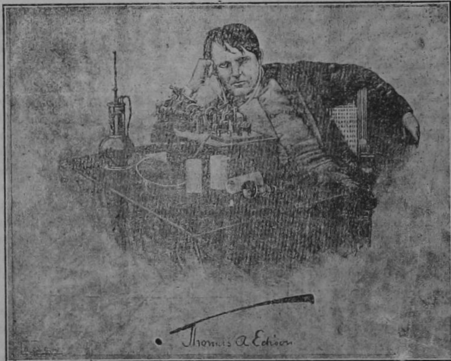
Tomas Alva Edison en 1889.

banco que apenas le cabían en toda la serie de bolsillos de su viejo y raído traje. Cuarenta mil dólares que le sirvieron para abrir una fábrica en la que ya podría hacer todos los experimentos que le diera la gana: telegrafía, plumas y máquinas de